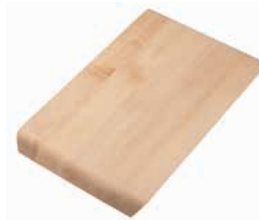
PLANCHE À DÉCOUPER - BOIS