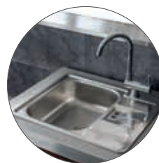
ÉVIER ENCASTRABLE MITIGEUR RABATTABLE