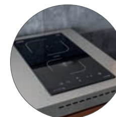
PLAQUE A INDUCTION