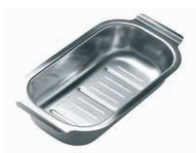
TAMIS POUR ÉVIER